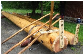
かじの葉 駐車場でその日をおんばしら

夏休みに頑張った取り組んだ作品が各学年の廊下に展示されています。力作ぞろいです!!