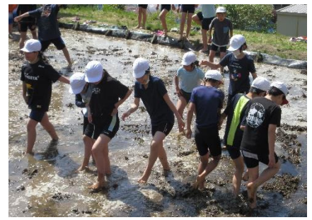
おいしいお米が育ちますように。