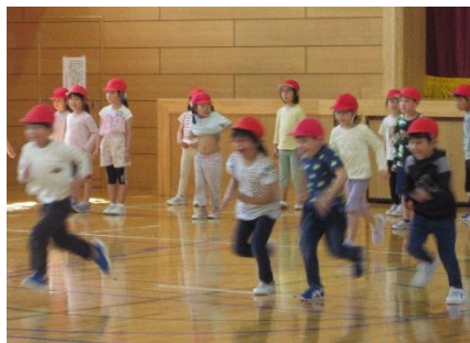
運動会、かっこよく走りたいです。