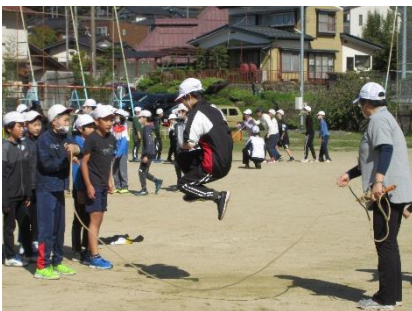
各学級の目標に向かって頑張ります。