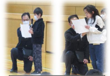
3年生代表児童 めあて発表

「今年は、北小学校でこれを楽しむ」ということを一つ決めてきてくださいとお願いしましたね。ちょっとインタビューしてみようと思います。