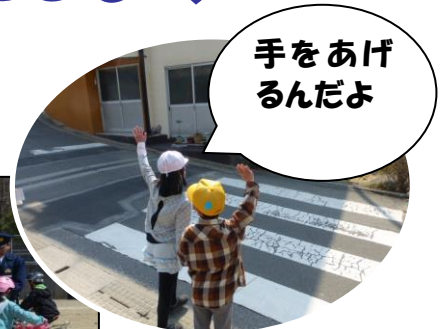
上 低学年の歩行訓練 左 中学年の自転車訓練

お家の皆さんをはじめ、地域、町、警察署、消防署の方々などたくさんの方に見守られていることをしっかり心に留め、学習したことを実践して命を大切にしていきます。